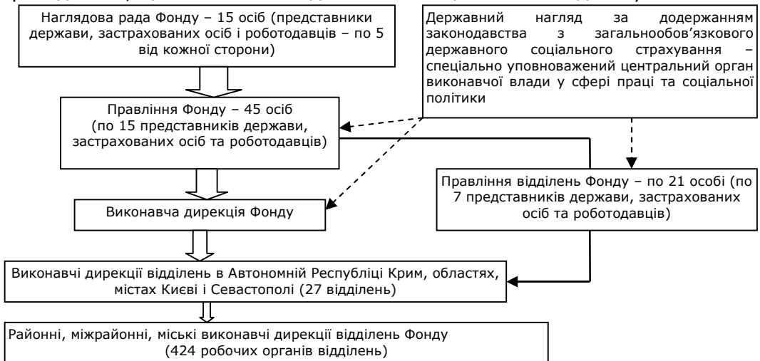
Рис. 2. Управління ФССзТВП

На нашу думку, соціальне страхування з тимчасової втрати працездатності та витратами, зумовленими похованням, не лише захищає працюючих, а й служить механізмом суспільних інвестицій, доходи від яких повертаються у вигляді покращення якості життя населення, стабільності суспільства, формування спонукальних мотивів до праці. Право працюючих на соціальне страхування набуло значення одного з найважливіших прав людини і громадянина, що стало засобом досягнення соціальної злагоди в суспільстві.