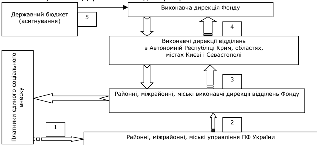
Рис. 3. Схема функціонування ФССЗТВП

5. Асигнування з Державного бюджету України.